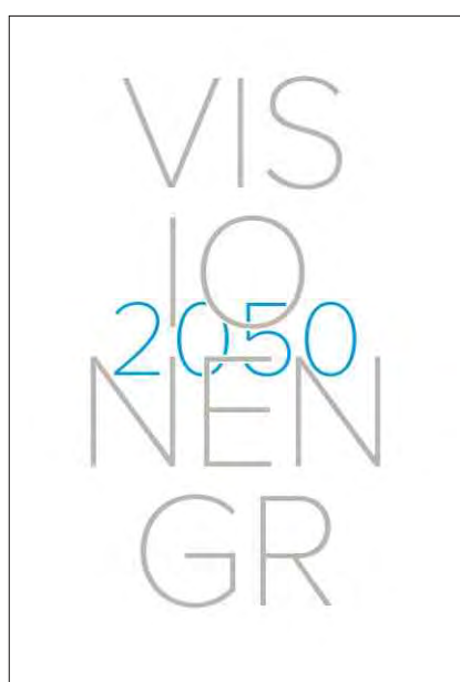
Cuverta dal cudesch.

Enconuscentamain na dependa il futur betg mo da quai che nus faschain, mabain er da quai che nus tralashain. Da resguardar quai è tant pli impurtant, perquai ch'il mund vegn – per exempel tenor il futurist Gerd Leonhard (*1961)